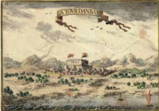
Castillo de Torredembarra. Grabado del perfil de Torredembarra, también realizado por el militar Beaulieu. El castillo ocupa un lugar preeminente, sobresaliendo por encima de todos los edificios, incluso de la iglesia.