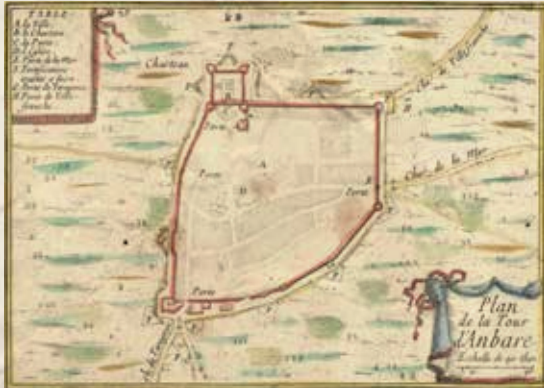
Plano de Torredembarra, ...realizado en el siglo XVII por el Caballero de Beaulieu, ingeniero militar al servicio de Luis XIV de Francia. El castillo ocupaba el ángulo de la muralla y era el principal baluarte.

Se le considera uno de los miembros más destacados de la saga y consolidó el papel de la familia en el ámbito político y social. Murió en Tarragona y fue enterrado en la capilla de San Jorge de la iglesia de Torredembarra , también conocida como la “capilla de los señores”.