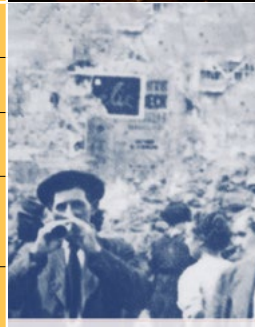
La gralla a Torredembarra i la tradició musical a la vila